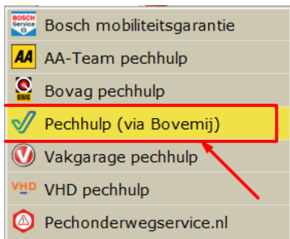
Figuur 2 (Pechhulp menu vanuit het kenteken-muteren-scherm in CSS)

Je krijgt het volgende menu te zien. Kies voor de optie Pechhulp (via Bovemij) . (Zie Figuur 2)